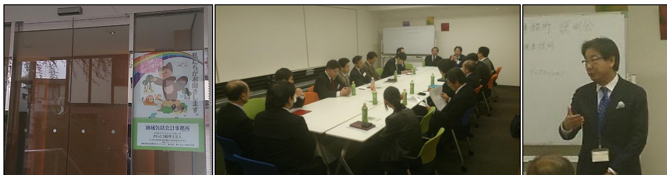
事務所の玄関にはポスター掲示をして地域への発信も行っています。

第2部は参加者間のディスカッションを行い、自己紹介や大田区への思いについて様々な意見が出ました。今回、参加された方は弁護士、社会保険労務士、行政書士、司法書士、不動産業、保険業などの方で、いずれも昔から大田区や地域住民とのかかわりの深い方が多く、地域の現状に何かアクションを興したい方が中心となっています。サイトウアソシエイツ地域包括会計事務所の今後の活動に期待が持てる内容となり第1回目の説明会は大成功で閉幕しました。次回の開催は6月頃を予定しているようで、今後、より具体的に大田区のための活動をおこしていくようです。